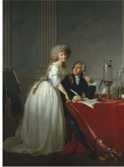
Antoine-Laurent Lavoisier et sa femme, par Jacques-Louis David (1788)

8. Comparez cette image avec le tableau présentant Marie-Anne Pierrette Paulze, la femme de Lavoisier, qui elle-aussi a joué un rôle très important dans le succès de son mari, comme scientifique, traductrice et illustratrice.